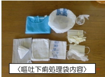
〈嘔吐下痢処理袋内容〉

次亜塩素酸希釈液・新聞紙 マスク 2・ぼろ布・ゴム手袋 3 ガウン 1・ポリ袋 2・落とし紙 ポリ袋のかかった洗面器（再度の嘔吐用）